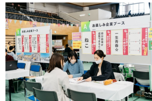
2024年3月 合同企業説明会当日の様子

本説明会では、企業と求職者が世代に対する印象を打開し、お互いを理解することから人材採用の可能性を広げていけるような機会にするため、求職者と企業様がお互いに歩み寄れるような企画を準備しております。趣旨をご理解の上お申し込みください。