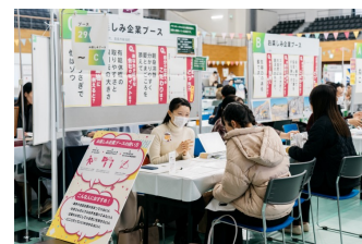
2024年3月 合同企業説明会当日の様子