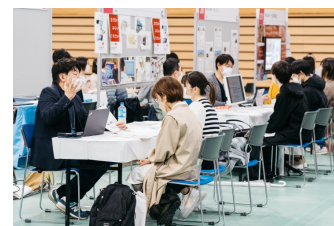
2023年3月 合同企業説明会当日の様子